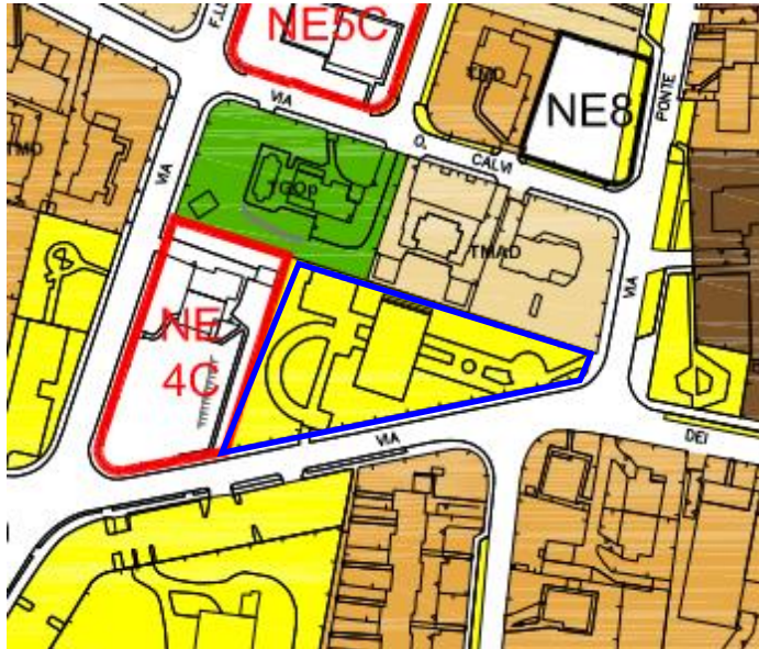
Estratto PGT. ————— area parco giochi